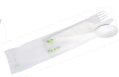
1VP219 TRIS C-PLA + TOVAGLIOLO (forchetta/coltello/cucchiaio/tovagliolo) (fork/knife/spoon/napkin) pz/cart pcs/box 250