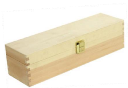
502350 CASSETTA CHIUSA 1 BOTTIGLIA PINO NATURALE dimensioni size 36x11 h10 cm pz/cart pcs/box 20