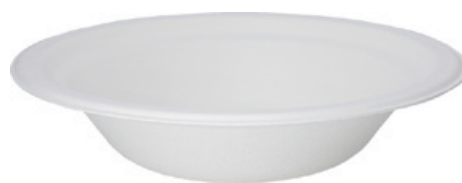
YDL044 PIATTO SCODELLA BIO-ECO diametro diameter 18 cm capacità capacity 400 cc pz/conf pcs/pack 50 pz/cart pcs/box 1000