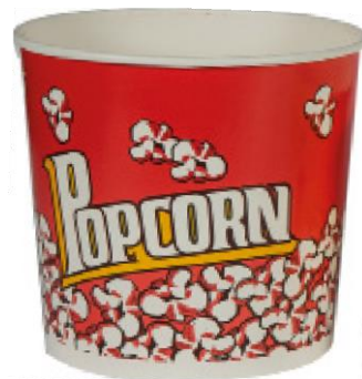
1BG063 CONTENITORE POP CORN EXTRA-LARGE capacità capacity 85oz / 2500ml pz/conf pcs/pack 50 pz/cart pcs/box 300