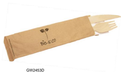
GW2453D BIS LEGNO + TOVAGLILO (forchette/coltello/tovagliolo) (fork/knife/napkin) pz/conf pcs/pack 50 pz/cart pcs/box 250