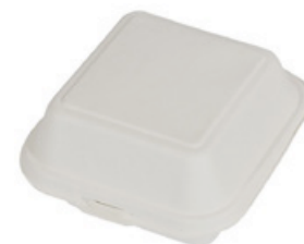
YDB003 CONTENITORE+COPERCHIO BIO-ECO dimensioni size 153x147 h48/78 mm capacità capacity 350 ml pz/conf pcs/pack 25 pz/cart pcs/box 500