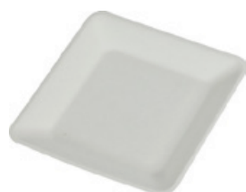
YDP036 PIATTO QUADRO BIO-ECO dimensioni size 16x16 cm pz/conf pcs/pack 50 pz/cart pcs/box 1000