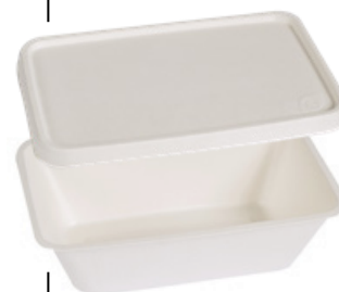
YDT011 COPERCHIO / LID BIO-ECO PER VASCHEFFA YDT012 pz/conf pcs/pack 50 pz/cart pcs/box 900