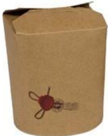
1BG080 TAKE AWAY BOX AVANA 500cc capacità capacity 500 cc pz/conf pcs/pack 50 pz/cart pcs/box 500