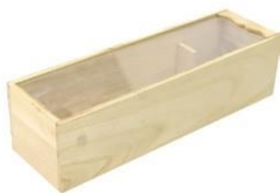
501271 CASSETTA LEGNO 1 BOTTIGLIA CON COPERCHIO TRASPARENTE dimensioni size 36x11 h10 cm pz/cart pcs/box 24