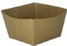
0310290 MONOPORZIONE AVANA 120cc dimensioni size 65x65h40 mm pz/conf pcs/pack 50 pz/cart pcs/box 1000