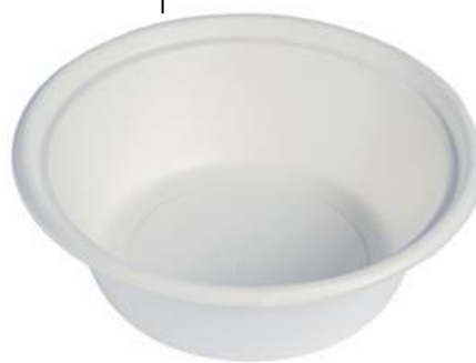
YDL085 CIOTOLONE BIO-ECO diametro diameter 21 cm capacità capacity 1200 cc pz/conf pcs/pack 50 pz/cart pcs/box 400