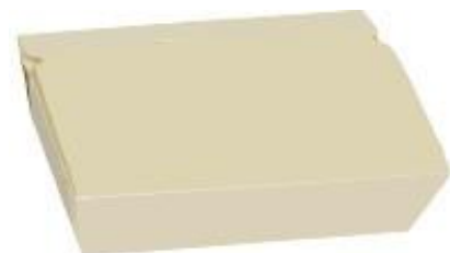
0310218 BOX ALIMENTI GRANDE dimensioni size 200x140h50 mm pz/conf pcs/pack 60 pz/cart pcs/box 240