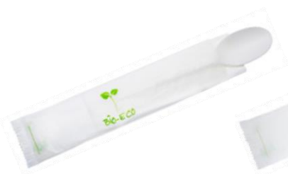
1VP213 CUCCHIAIO C-PLA + TOVAGLIOLO SPOON + NAPKIN pz/cart pcs/box 500