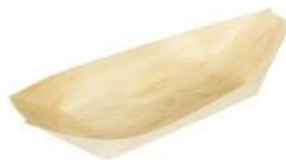
GW3018 BARCHETTA PALMA dimensioni size 220x115 mm pz/conf pcs/pack 50 pz/cart pcs/box 1000