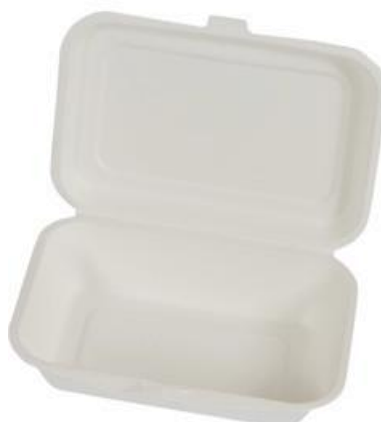
YDB030 CONTENITORE+COPERCHIO BIO-ECO dimensioni size 251x162 h50/63 mm capacità capacity 750 ml pz/conf pcs/pack 50 pz/cart pcs/box 500