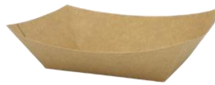
0310324 BARCHETTA ALIMENTI AVANA CERALACCA - 17 oz dimensioni sup. top size 170x120h40 mm dimensioni base bottom size 116x72 mm pz/conf pcs/pack 125 pz/cart pcs/box 1000