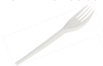
1VP220 FORCHETTA C-PLA dimensioni size 16,5 cm pz/conf pcs/pack 50 pz/cart pcs/box 1000