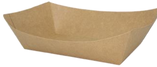
0310326 BARCHETTA ALIMENTI AVANA CERALACCA - 40 oz dimensioni sup. top size 224x140h58 mm dimensioni base bottom size 168x96 mm pz/conf pcs/pack 125 pz/cart pcs/box 500