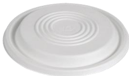
YDL086 COPERCHIO / LID CIOTOLONE BIO-ECO diametro diameter 21 cm pz/conf pcs/pack 50 pz/cart pcs/box 400