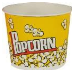
1BG062 CONTENITORE POP CORN LARGE capacità capacity 64oz / 1900ml pz/conf pcs/pack 50 pz/cart pcs/box 300