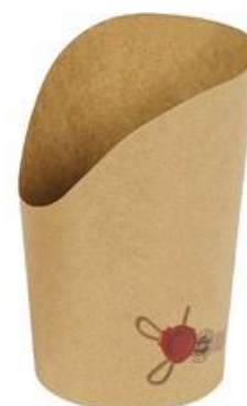
0310262 COPPA P/PATATINE AVANA GRANDE capacità capacity 24 oz dimensioni size Ø70 h78/130 mm pz/conf pcs/pack 50 pz/cart pcs/box 1000