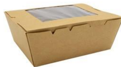
0310275 BOX ALIM. GRANDE CON FINESTRA - CERALACCA dimensioni size 215x160h65 mm pz/conf pcs/pack 50 pz/cart pcs/box 200