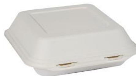
YDB026 CONTENITORE+COPERCHIO BIO-ECO dimensioni size 218x207 h40/64 mm capacità capacity 700 ml pz/conf pcs/pack 50 pz/cart pcs/box 250