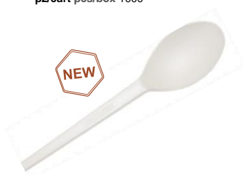
1VP225 CUCCHIAINO C-PLA dimensioni size 13 cm pz/conf pcs/pack 50 pz/cart pcs/box 1000