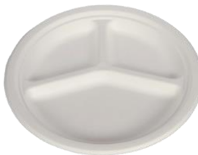
YDP007 PIATTO TRIS BIO-ECO diametro diameter 26 cm pz/conf pcs/pack 25 pz/cart pcs/box 800