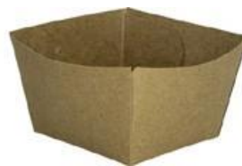
0310292 MONOPORZIONE AVANA 240cc dimensioni size 80x80h50 mm pz/conf pcs/pack 50 pz/cart pcs/box 1000