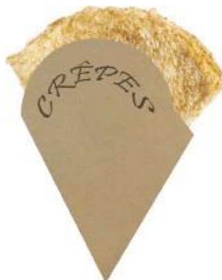
0310228 PORTA CRÊPES 1/8 CARTA pz/conf pcs/pack 250 pz/cart pcs/box 500