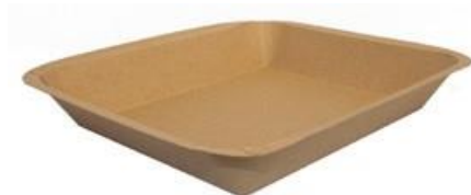
MT4 VASSOIO CA+PE AVANA KRAFT 400 ml dimensioni size 170x148h24mm pz/conf pcs/pack 50 pz/cart pcs/box 600