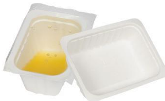
YDT049 VASCHEFFA BIO-ECO TURTLE SHELL dimensioni size 144x100 h65 mm capacità capacity 500 cc pz/conf pcs/pack 30 pz/cart pcs/box 360