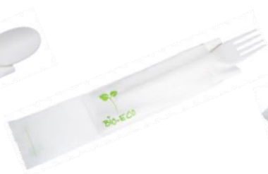
1VP215 FORCHETTA C-PLA + TOVAGLIOLO FORK + NAPKIN pz/cart pcs/box 500