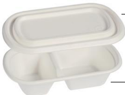
YDB045 COPERCHIO / LID BIO-ECO PER VASCHEFFA YDB047 pz/conf pcs/pack 50 pz/cart pcs/box 500