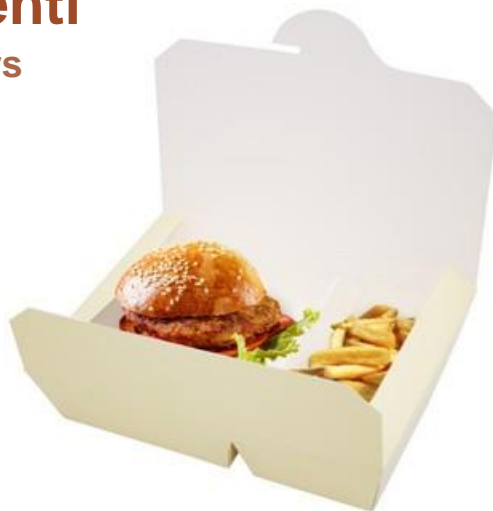
0310217 BOX ALIM. BISCOMP. CREMA dimensioni size 195x140h45 mm pz/conf pcs/pack 60 pz/cart pcs/box 240