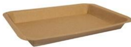
MT5 VASSOIO CA+PE AVANA KRAFT 230 ml dimensioni size 170x122h16mm pz/conf pcs/pack 100 pz/cart pcs/box 1200