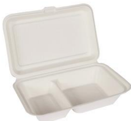
YDB040 CONTENITORE+COPERCHIO BIO-ECO BISCOMPARTI dimensioni size 240x160 h50 mm capacità capacity 650 ml pz/conf pcs/pack 50 pz/cart pcs/box 250