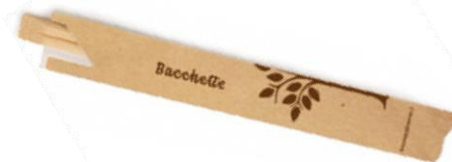
GW2509 FORCHETTINA LEGNO 2 PUNTE dimensioni size 12 cm pz/conf pcs/pack 1000 pz/cart pcs/box 10000