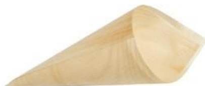
GW3030 CONO PALMA dimensioni size 180x130 mm pz/conf pcs/pack 50 pz/cart pcs/box 1000