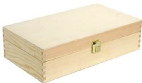
502352 CASSETTA CHIUSA 2 BOTTIGLIE PINO NATURALE dimensioni size 35x19 h9 cm pz/cart pcs/box 12