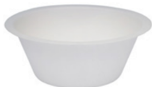
YDL015 COPPETTA BIO-ECO diametro diameter 11,5 cm capacità capacity 250 cc pz/conf pcs/pack 50 pz/cart pcs/box 1500