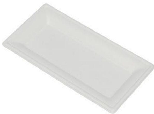
YDP280 VASSOIO RETTANGOLARE BIO-ECO dimensioni size 28x20 cm pz/conf pcs/pack 25 pz/cart pcs/box 500