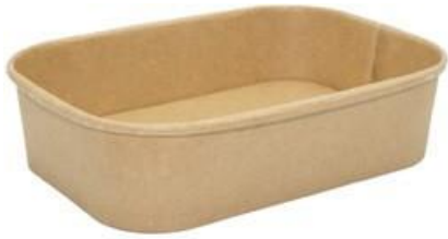
1BG180 PAPER BOWL R600 CERALACCA capacità capacity 600 ml dimensioni size Ø168x120h45 mm pz/conf pcs/pack 50 pz/cart pcs/box 300