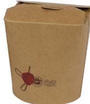
1BG084 TAKE AWAY BOX AVANA 1000cc capacità capacity 1000 cc pz/conf pcs/pack 50 pz/cart pcs/box 500