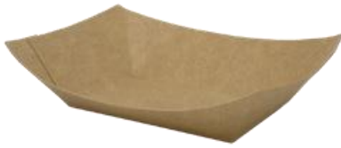
0310321 BARCHETTA ALIMENTI AVANA CERALACCA - 7oz dimensioni sup. top size 125x88h38 mm dimensioni base bottom size -- pz/conf pcs/pack 125 pz/cart pcs/box 1000