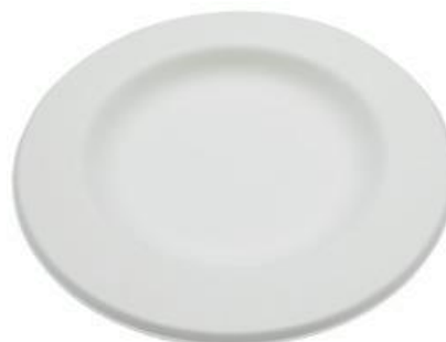
YFYP10 PIATTO STYLE BIO-ECO BORDO LARGO diametro diameter 26 cm pz/conf pcs/pack 50 pz/cart pcs/box 500