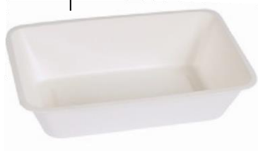
YDB063 VASCHEFFA BIO-ECO dimensioni size 203x136 h50 mm capacità capacity 1000 cc pz/conf pcs/pack 50 pz/cart pcs/box 600