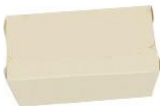
0310214 BOX ALIMENTI PICCOLO dimensioni size 160x110h50 mm pz/conf pcs/pack 80 pz/cart pcs/box 480