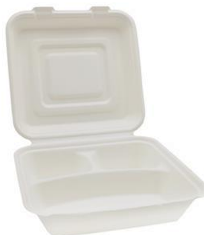
YDB032 CONTENITORE+COPERCHIO BIO-ECO TRISCOMPARTI dimensioni size 238x234 h55/76 mm capacità capacity 1000 ml pz/conf pcs/pack 50 pz/cart pcs/box 250