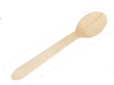
GW2405 CUCCHIAIO LEGNO dimensioni size 16 cm pz/conf pcs/pack 100 pz/cart pcs/box 2000