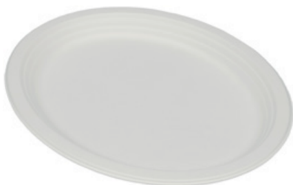
YDP020 VASSOIO OVALE BIO-ECO dimensioni size 26x20 cm pz/conf pcs/pack 25 pz/cart pcs/box 800