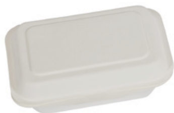
YDB001 CONTENITORE+COPERCHIO BIO-ECO dimensioni size 191x136 h44/59 mm capacità capacity 500 ml pz/conf pcs/pack 25 pz/cart pcs/box 500