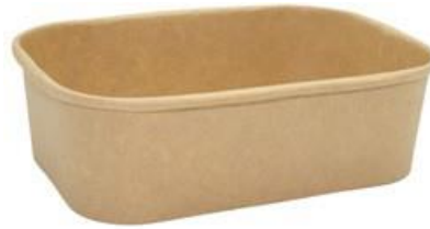
1BG181 PAPER BOWL R750 CERALACCA capacità capacity 750 ml dimensioni size Ø168x120h55 mm pz/conf pcs/pack 50 pz/cart pcs/box 300