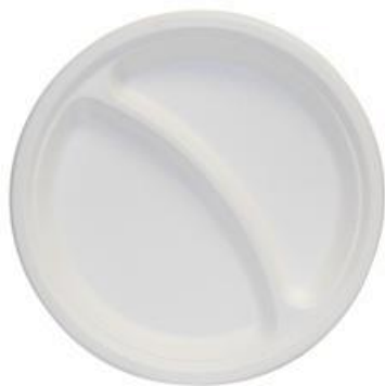
YDP038 PIATTO BIS BIO-ECO diametro diameter 22 cm pz/conf pcs/pack 25 pz/cart pcs/box 500