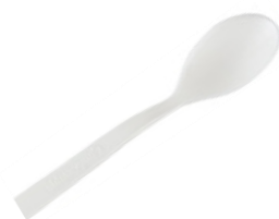
1VP226 CUCCHIAINO C-PLA dimensioni size 10,5 cm pz/conf pcs/pack 100 pz/cart pcs/box 2000