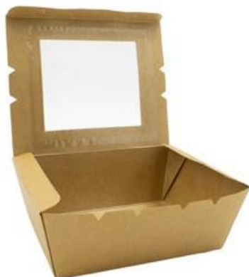
0310265 BOX ALIM. MEDIO CON FINESTRA - CERALACCA dimensioni size 175x140h65 mm pz/conf pcs/pack 50 pz/cart pcs/box 200