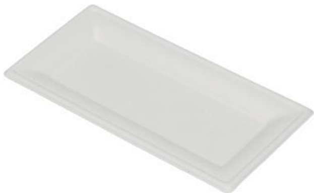
YDP037 VASSOIO RETTANGOLARE BIO-ECO dimensioni size 26x13 cm pz/conf pcs/pack 25 pz/cart pcs/box 500