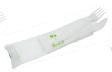
1VP216 BIS C-PLA + TOVAGLIOLO (forchetta/coltello/tovagliolo) (fork/knife/napkin) pz/cart pcs/box 250