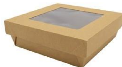
0310288 BOX ALIM. GRANDE CONT.+COPERCHIO FINESTRA - CERALACCA dimensioni sup. size 195x195h52 mm pz/conf pcs/pack 30 pz/cart pcs/box 180