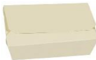
0310216 BOX ALIMENTI MEDIO dimensioni size 180x120h50 mm pz/conf pcs/pack 60 pz/cart pcs/box 360