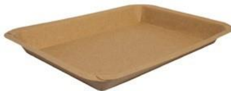
MT2 VASSOIO CA+PE AVANA KRAFT 520 ml dimensioni size 203x163h22 mm pz/conf pcs/pack 100 pz/cart pcs/box 600