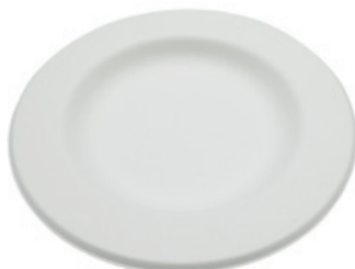
YFYP07 PIATTO STYLE BIO-ECO BORDO LARGO diametro diameter 18 cm pz/conf pcs/pack 50 pz/cart pcs/box 1000