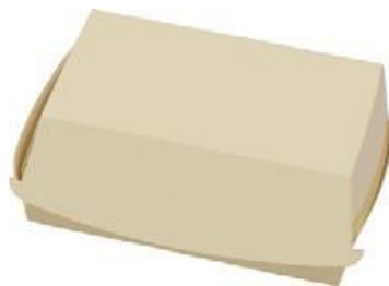
0310204 BOX PANINO RETTANGOLARE dimensioni size 150x100h70 mm pz/conf pcs/pack 100 pz/cart pcs/box 600