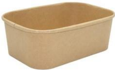
1BG182 PAPER BOWL R900 CERALACCA capacità capacity 900 ml dimensioni size Ø168x120h65 mm pz/conf pcs/pack 50 pz/cart pcs/box 300