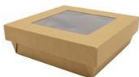
0310286 BOX ALIM. PICCOLO CONT.+COPERCHIO FINESTRA - CERALACCA dimensioni sup. size 143x143h50 mm pz/conf pcs/pack 30 pz/cart pcs/box 240