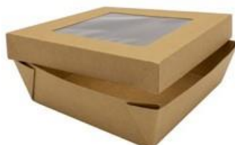
0310287 BOX ALIM. MEDIO CONT.+COPERCHIO FINESTRA - CERALACCA dimensioni sup. size 163x163h51 mm pz/conf pcs/pack 30 pz/cart pcs/box 240