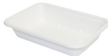
YDT012 VASCHEFFA BIO-ECO dimensioni size 170x110 h35 mm capacità capacity 400 ml pz/conf pcs/pack 50 pz/cart pcs/box 600