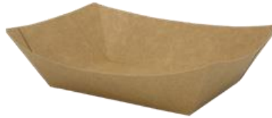
0310322 BARCHETTA ALIMENTI AVANA CERALACCA - 10 oz dimensioni sup. top size 150x110h41 mm dimensioni base bottom size 100x62 mm pz/conf pcs/pack 125 pz/cart pcs/box 1000