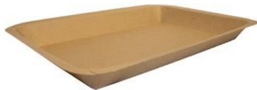
MT1 VASSOIO CA+PE AVANA KRAFT 680 ml dimensioni size 248x174h22 mm pz/conf pcs/pack 100 pz/cart pcs/box 600