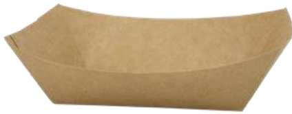
0310325 BARCHETTA ALIMENTI AVANA CERALACCA - 27 oz dimensioni sup. top size 200x125h53 mm dimensioni base bottom size 138x85 mm pz/conf pcs/pack 125 pz/cart pcs/box 500