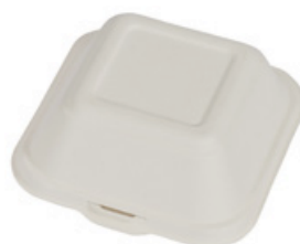
YDB024 CONTENITORE+COPERCHIO BIO-ECO dimensioni size 145x141 h47/75 mm capacità capacity 310 ml pz/conf pcs/pack 50 pz/cart pcs/box 500