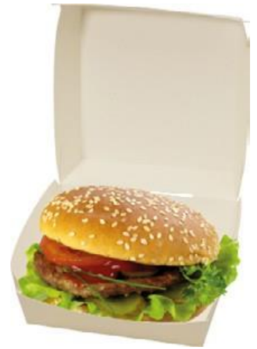
0310205 BOX PANINO MAXI dimensioni size 160x155h90 mm pz/conf pcs/pack 50 pz/cart pcs/box 300