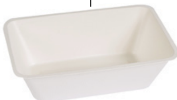
YDB064 VASCHEFFA BIO-ECO dimensioni size 203x136 h68 mm capacità capacity 1300 cc pz/conf pcs/pack 50 pz/cart pcs/box 600