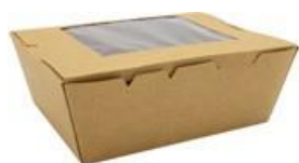
0310263 BOX ALIM. PICCOLO CON FINESTRA - CERALACCA dimensioni size 130x110h65 mm pz/conf pcs/pack 50 pz/cart pcs/box 200