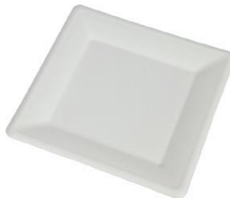
YDP031 PIATTO QUADRO BIO-ECO dimensioni size 26x26 cm pz/conf pcs/pack 25 pz/cart pcs/box 500