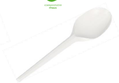
1VP222 CUCCHIAIO C-PLA dimensioni size 16,5 cm pz/conf pcs/pack 50 pz/cart pcs/box 1000