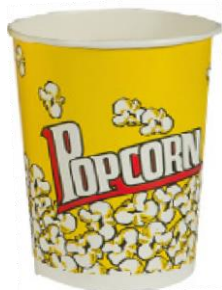
1BG060 CONTENITORE POP CORN SMALL capacità capacity 32oz / 950ml pz/conf pcs/pack 50 pz/cart pcs/box 500