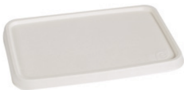
YDB062 COPERCHIO / LID BIO-ECO PER VASCHEFFE YDB063-YDB064 pz/conf pcs/pack 50 pz/cart pcs/box 600