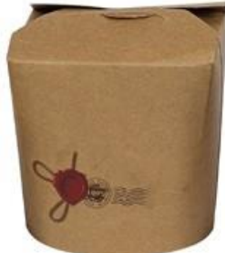
1BG082 TAKE AWAY BOX AVANA 750cc capacità capacity 750 cc pz/conf pcs/pack 50 pz/cart pcs/box 500