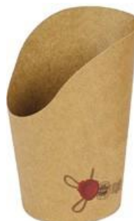
0310260 COPPA P/PATATINE AVANA PICCOLO capacità capacity 8 oz dimensioni size Ø60 h67/115 mm pz/conf pcs/pack 50 pz/cart pcs/box 1000