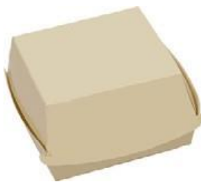
0310202 BOX PANINO MEDIO dimensioni size 120x120h70 mm pz/conf pcs/pack 100 pz/cart pcs/box 600