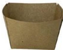
0310291 MONOPORZIONE AVANA 180cc dimensioni size 72x72h45 mm pz/conf pcs/pack 50 pz/cart pcs/box 1000