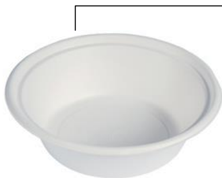
YDL084 CIOTOLONE BIO-ECO diametro diameter 21 cm capacità capacity 900 cc pz/conf pcs/pack 50 pz/cart pcs/box 400