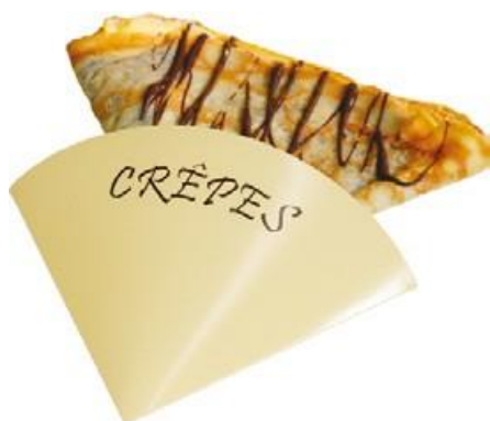
0310226 PORTA CRÊPES 1/4 CARTONCINO POLITENATO CREMA pz/conf pcs/pack 250 pz/cart pcs/box 500

Pure cellulose paper obtained matching white paper (inside) with kraft one (outside)