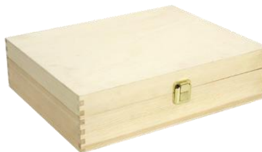
502354 CASSETTA CHIUSA 3 BOTTIGLIE PINO NATURALE dimensioni size 35x27 h9 cm pz/cart pcs/box 12