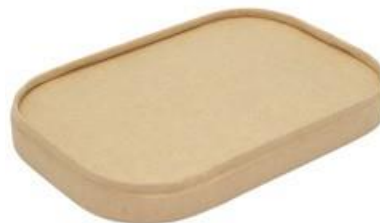
1BG185 COPERCHIO CARTA AVANA NEUTRO PER 1BG180/1/2/3 pz/conf pcs/pack 25 pz/cart pcs/box 300