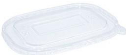
pz/conf pcs/pack 50 pz/cart pcs/box 300