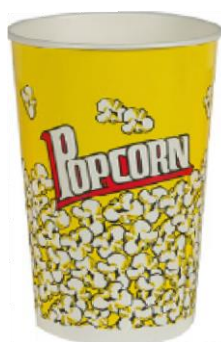
1BG061 CONTENITORE POP CORN MEDIUM capacità capacity 46oz / 1360ml pz/conf pcs/pack 50 pz/cart pcs/box 500