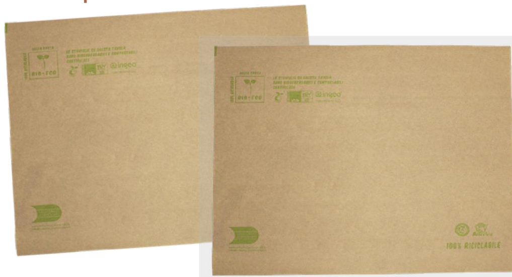
2VR116 TOVAGLIETTA ECOLOGICA CARTA AVANA 70 gr dimensioni size 33x44 cm pz/conf pcs/pack 500 pz/cart pcs/box 1500