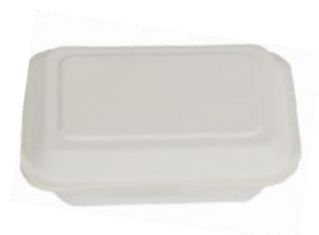
YDB004 CONTENITORE+COPERCHIO BIO-ECO dimensioni size 172x113 h37/52 mm capacità capacity 350 ml pz/conf pcs/pack 50 pz/cart pcs/box 1000