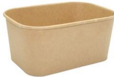
1BG183 PAPER BOWL R1000 CERALACCA capacità capacity 1000 ml dimensioni size Ø168x120h75 mm pz/conf pcs/pack 50 pz/cart pcs/box 300