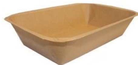
MT3 VASSOIO CA+PE AVANA KRAFT 800 ml dimensioni size 209x139h43 mm pz/conf pcs/pack 100 pz/cart pcs/box 600