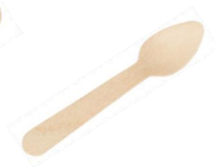
GW2407 CUCCHIAINO LEGNO dimensioni size 11 cm pz/conf pcs/pack 100 pz/cart pcs/box 5000