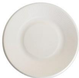
YDP003 PIATTO BIO-ECO diametro diameter 21 cm pz/conf pcs/pack 50 pz/cart pcs/box 500