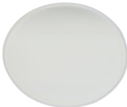
YDP033 PIATTO PIZZA BIO-ECO diametro diameter 33 cm pz/conf pcs/pack 25 pz/cart pcs/box 500