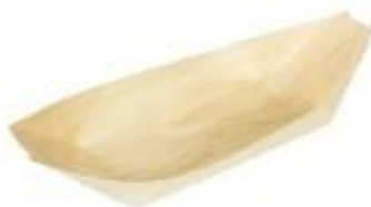
GW3017 BARCHETTA PALMA dimensioni size 170x97 mm pz/conf pcs/pack 50 pz/cart pcs/box 1000