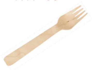
GW2404 FORCHETTA LEGNO dimensioni size 16 cm pz/conf pcs/pack 100 pz/cart pcs/box 2000