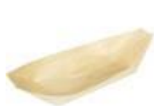
GW3015 BARCHETTA PALMA dimensioni size 115x70 mm pz/conf pcs/pack 50 pz/cart pcs/box 1000