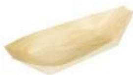
GW3016 BARCHETTA PALMA dimensioni size 145x87 mm pz/conf pcs/pack 50 pz/cart pcs/box 1000