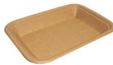
MT6 VASSOIO CA+PE AVANA KRAFT 430 ml dimensioni size 205x141h24mm pz/conf pcs/pack 100 pz/cart pcs/box 600