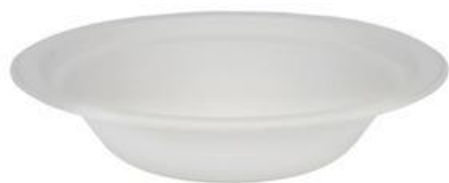
YDL006 PIATTO FONDO BIO-ECO diametro diameter 19 cm capacità capacity 680 cc pz/conf pcs/pack 25 pz/cart pcs/box 1200