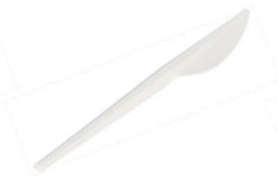
1VP224 COLTELLO C-PLA dimensioni size 16,5 cm pz/conf pcs/pack 50 pz/cart pcs/box 1000